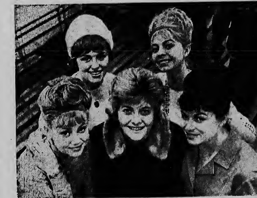
Esakinan ta e cinco candidatanan cu ta competi pa representacion di Dinamarca den e Eurovisiesongfestival cu lo worde tene na Londen.